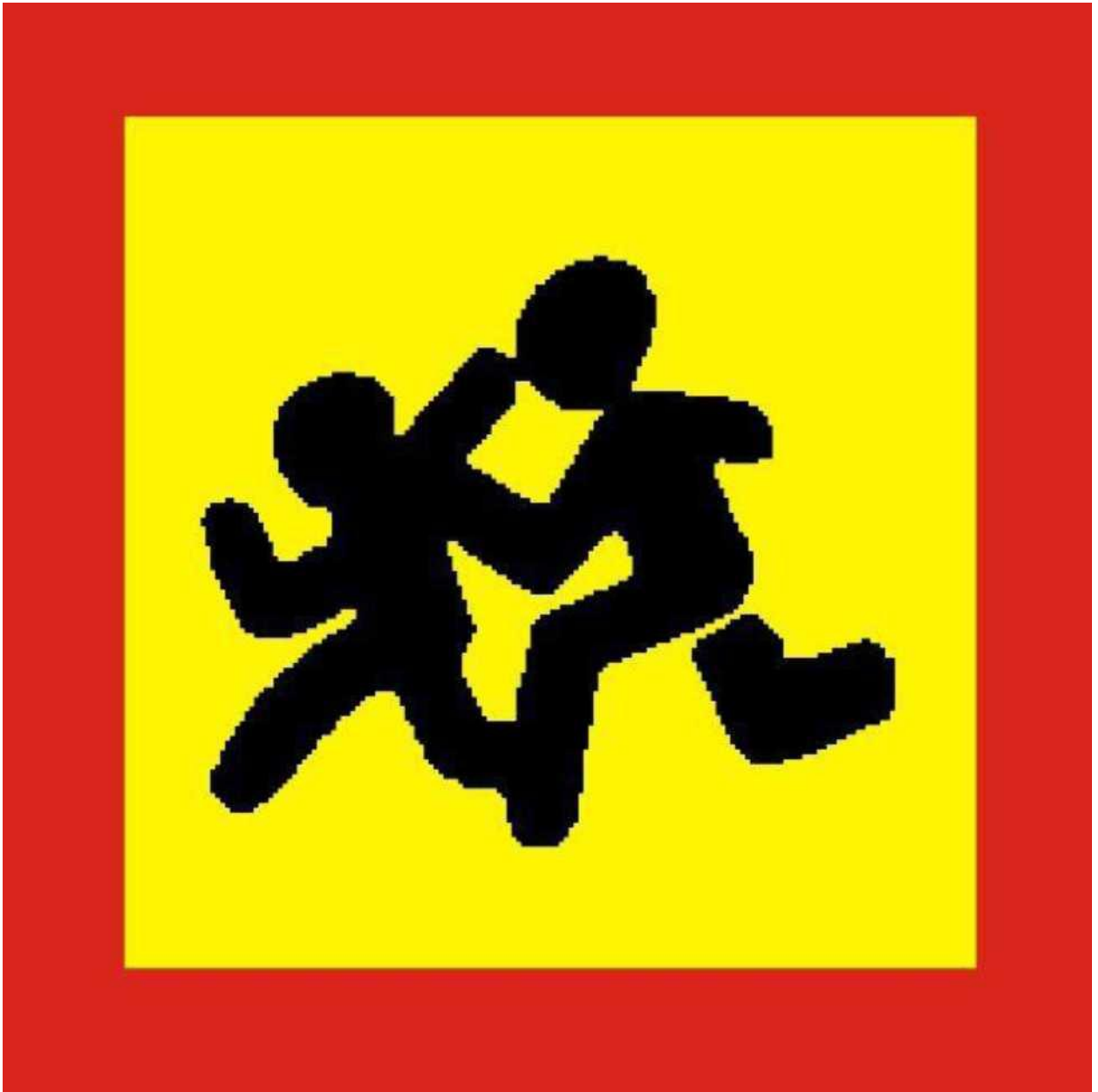
Опознавательный знак «Перевозка детей»

«Перевозка детей» - квадрат желтого цвета с каймой красного цвета (ширина каймы - 1/10 стороны), с черным изображением символа дорожного знака 1.23 «Дети» при этом сторона квадрата опознавательного знака, расположенного спереди транспортного средства, должна быть не менее 250 мм, сзади - 400 мм.